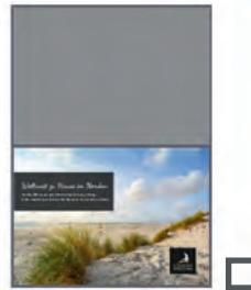
1/2 Seite quer 173 x 124 mm* 555 €