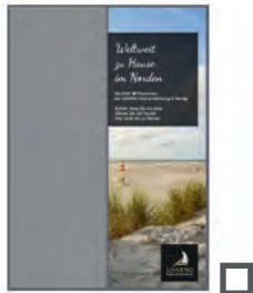
1/2 Seite hoch 297 x 109 mm* 555 €