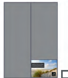
1/8 Seite quer 84 x 62 mm 255 €

* zusätzlich 3 mm Beschneit - Alle Anzeigen 4-farbig