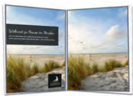
2/1 Doppelseite 370 x 261 mm* 1.755 €

Platzierungswunsch (sofern verfügbar) - 10% Aufpreis