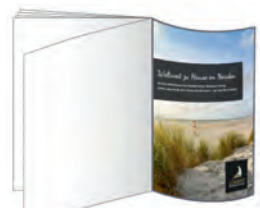
Umschlagseite U3 185 x 261 mm* 1.155 €