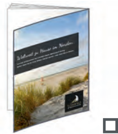
Umschlagseite U4 185 x 261 mm* 1.455 €