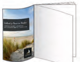
Umschlagseite U2 185 x 261 mm* 1.255 €