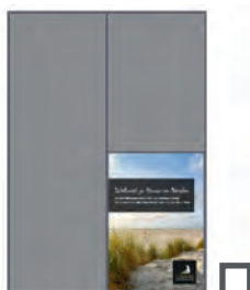
1/4 Seite hoch 84 x 124 mm* 355 €