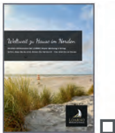
1/1 Seite 185 x 261 mm* 955 €