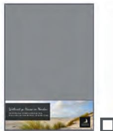
1/4 Seite quer 173 x 60 mm* 355 €