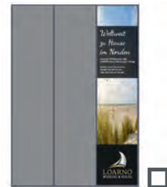
1/3 Seite hoch 79 x 297mm* 455 €